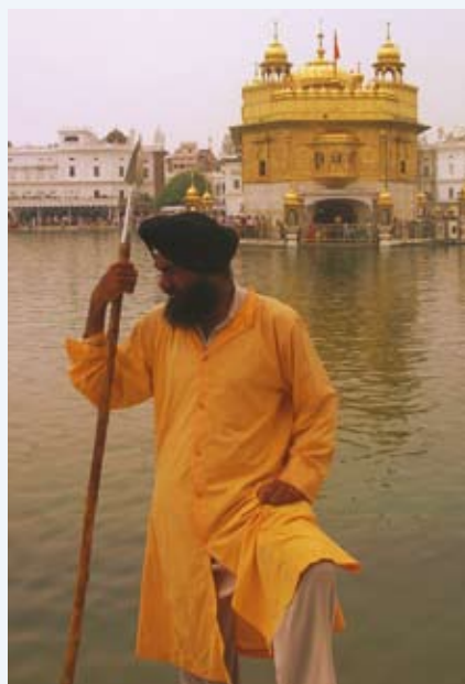
Wachter van de Gouden Tempel.