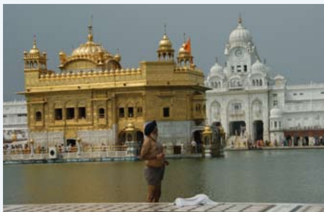
De 'Gouden Tempel' in Amritsar.

wel comfortabel. Het eten van 'meals on wheels' was dan weer niet te vreten. Na een rit van een zestal uur door eindeloze rijstvelden bereikten we de hoofdstad van de Punjab en van de Sikhs. Het was hier al dezelfde heksenketel als in Delhi, alleen nog warmer. De thermometer steeg hier naar 46 graden! Nog altijd geen moesson. De meest belangrijke attractie van de stad is natuurlijk de 'gouden tempel'. Maar die viel eerst feitelijk tegen. Hij leek kleiner en veel minder gouden dan we verwacht hadden. Tenslotte bleek het dan ook over een andere tempel te gaan, de Durgiana. De echte tempel, waar we even later aankwamen, was wel schitterend. Wel helemaal van goud, gelegen in het midden van een enorme vierkante vijver, en omringd door glanzende witte bijgebouwen verbonden door galerijen. Vele Sikhs namen daar een bad in het heilige water. Om de binnenkant van de tempel te bereiken hadden we urenlang moeten aanschuiven, en we hebben dat dan maar overgeslagen, en ons wegens de hitte neergevlid in de schaduw van de galerijen waar grote ronddraaiende ventilatoren voor een beetje afkoeling zorgden. Enkel maar het zien voorbij wandelen van de