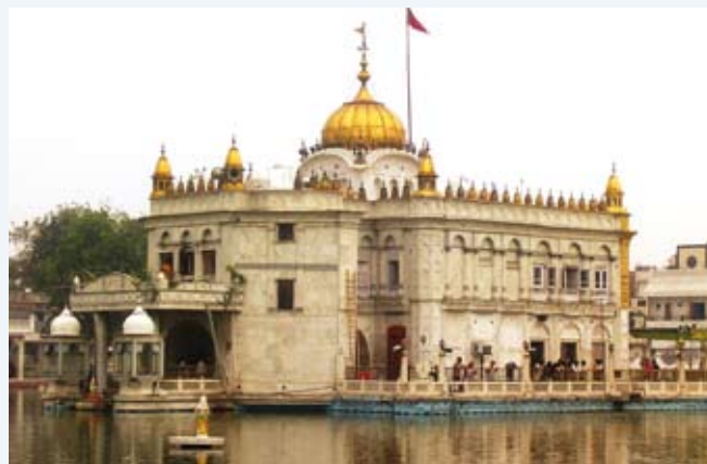
De Durgiana tempel in Amritsar.

had men langs de andere kant de laatste jaren toch ook een blinkend nieuw luchtgekoeld metronet aangelegd. De schrik voor de bacteriën was nu vervangen door die voor terroristen. Zowat op alle plaatsen waar veel mensen samenkomen was er controle zo streng als op de luchthavens, compleet met fouillering, bagagescans en metaaldetectoren. We maakten dit mee bij het betreden van metrostations, tempels en zelfs de bioscoop. We zijn inderdaad eens een Bollywood-film gaan zien. Aan te raden! Tenslotte begint een mens toch ook wat na te denken als er zelfs hier en daar tot de tanden gewapende militairen achter muurtjes van zandzakjes staan! Ik had alle bezienswaardigheden van de Indiase hoofdstad feitelijk al gezien, maar gelukkig was er de laatste jaren een nieuw monument bijgekomen. Aan de andere kant van de Yamunarivier verrijst nu een enorm tempelcomplex van 40 hectaren, de Swaminarayan Akshardam. Het is op vijf jaar tijd gebouwd door de BAPS, een 'sociaal-spirituele' NGO met miljoenen adepten. Het zijn de volgelingen van de goeroe Baghwan Swaminarayan uit de tijd van Napoleon. Het complex bestaat uit een overvloedig versierde tempel en een 'ongeveer evenaarde verzameling Indiase kunst, wijsheid, erfgoed en waarden'. Ze hadden zelfs foldertjes in goed Nederlands.