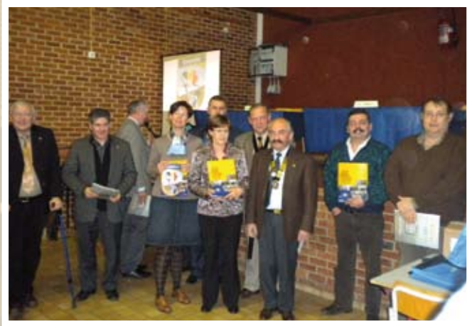
Le Gouverneur et les Présidents

Au cours d'un repas, les candidats doivent répondre, sur la durée du jeu, à environ une centaine de questions de culture générale. Ils sont encouragés par les membres de leur club, dans un chahut indescriptible, les uns maniant des couvercles de casseroles, des tambours et même des trompettes. Ce jeu est organisé chaque année par un club différent.