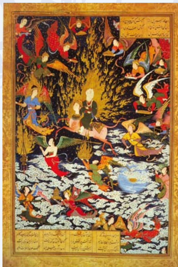
Une miniature persane du XVIe siècle célébrant l'ascension de Mahomet aux cieux.