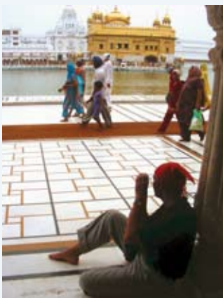
Toerist met verplicht hoofddoekje.