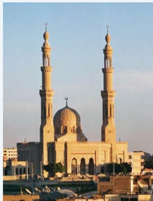
Mosquée d'Assouan en Egypte.