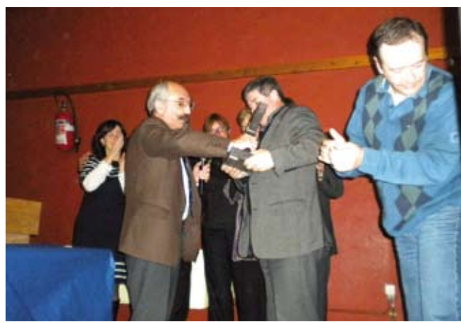
Le Gouverneur remet le trophée aux vainqueurs

Le jeu ? Ne croyez surtout pas que le principal but est de répondre à des questions. Non ! Ça, c'est uniquement pour les quelques malheureux qui se trouvent sur la scène. En réalité pour la majorité des Kiwaniens présents,