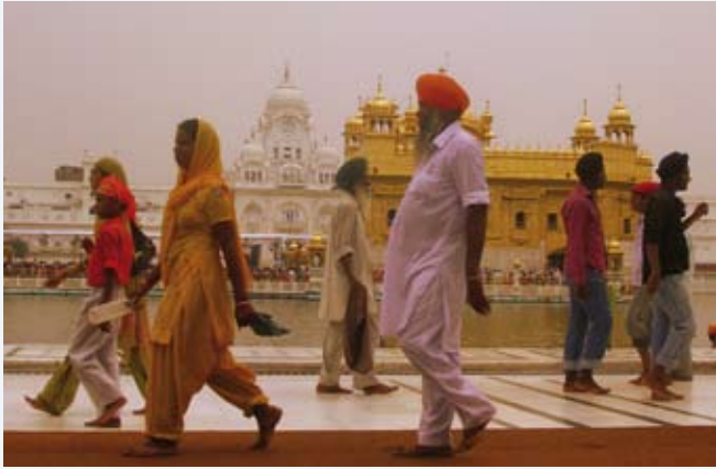
Pittoreske Sikh Pelgrims.

vrouwen met hun kleurrijke sari's en de mannen met hun mooie tulbanden was al een spektakel op zichzelf. Wij vonden deze mensen erg pittoresk, maar, houdt U vast, die mensen vonden dat van ons ook. Regelmatig moesten wij met allerlei kindjes op de foto! We waren dan ook de enige toeristen tussen duizenden Sikhs. Het complex werd bewaakt door rijzige wachters in gele gewaden bewapend met speren. Ze hadden zo een beetje de functie van de 'suisse' in onze kerken vroeger. Als sommige gelovigen zich wilden neervlijen of met hun voetzolen in de richting van de tempel gingen zitten, werden ze met de punt van de speer aangeprikt. In één van de tempelwinkeltjes heb ik een souvenirje gekocht, een echte Sikh dolk. Voor 200 roepies kunt ge toch niet sukkelen. Iedere mannelijke Sikh moet immers zoiets op zak hebben. In België is dit soort wapendracht feitelijk verboden, maar voor die mannen wordt een uitzondering gemaakt omdat het maar om 'ceremoniële' dingen gaat, die om 'religieuze redenen' gedragen worden. Ik kan U echter verzekeren dat het exemplaar dat nu op mijn bureau ligt vlijmscherp is! Tenslotte nog wat geschiedenis. In Juni 1984 beval Indira Ghandi 'Operation Blue Star', een aanval met tanks op deze tempel, omdat zich daar gewapende separatisten verscholen hadden. Er vielen meer dan 500 doden en er was heel wat schade aan de witte gebouwen van de omheining. De schade aan de tempel zelf viel