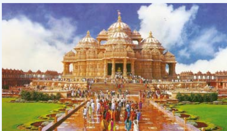
De Akshardam tempel in Delhi.