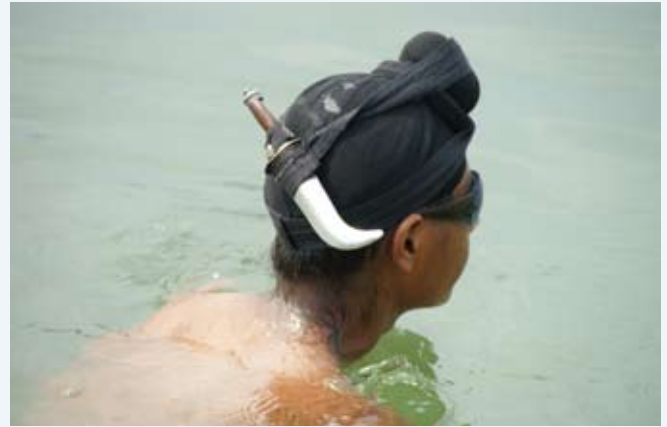
Ik zwem nooit zonder.

vrouwen met hun kleurrijke sari's en de mannen met hun mooie tulbanden was al een spektakel op zichzelf. Wij vonden deze mensen erg pittoresk, maar, houdt U vast, die mensen vonden dat van ons ook. Regelmatig moesten wij met allerlei kindjes op de foto! We waren dan ook de enige toeristen tussen duizenden Sikhs. Het complex werd bewaakt door rijzige wachters in gele gewaden bewapend met speren. Ze hadden zo een beetje de functie van de 'suisse' in onze kerken vroeger. Als sommige gelovigen zich wilden neervlijen of met hun voetzolen in de richting van de tempel gingen zitten, werden ze met de punt van de speer aangeprikt. In één van de tempelwinkeltjes heb ik een souvenirje gekocht, een echte Sikh dolk. Voor 200 roepies kunt ge toch niet sukkelen. Iedere mannelijke Sikh moet immers zoiets op zak hebben. In België is dit soort wapendracht feitelijk verboden, maar voor die mannen wordt een uitzondering gemaakt omdat het maar om 'ceremoniële' dingen gaat, die om 'religieuze redenen' gedragen worden. Ik kan U echter verzekeren dat het exemplaar dat nu op mijn bureau ligt vlijmscherp is! Tenslotte nog wat geschiedenis. In Juni 1984 beval Indira Ghandi 'Operation Blue Star', een aanval met tanks op deze tempel, omdat zich daar gewapende separatisten verscholen hadden. Er vielen meer dan 500 doden en er was heel wat schade aan de witte gebouwen van de omheining. De schade aan de tempel zelf viel