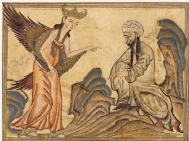
Mahomet et l'ange Gabriel

La révélation : Dieu s'est manifesté aux hommes par les prophètes. Dans le CORAN sont mentionnés à plusieurs reprises la Thora, l'Évangile, les psaumes de David. Sont évoqués Abraham, Isaac, Zacharie, la Vierge Marie qui sera la mère de Jésus, etc.