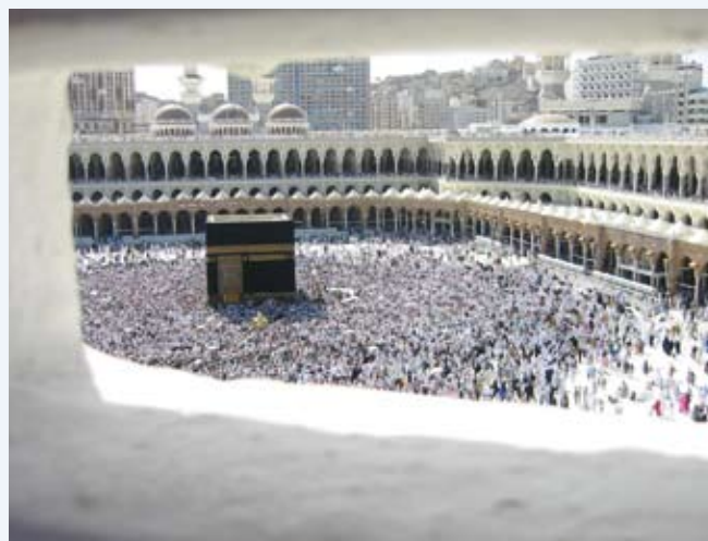
Grande mosquée de La Mecque avec la Ka'ba en son centre

La création : on y retrouve les traits essentiels du récit biblique. ALLAH a créé et ordonné le Ciel et la Terre en 6 jours, puis il a créé Adam, le premier homme.