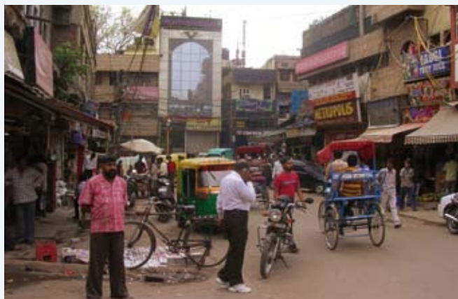
Straatbeeld in Delhi.