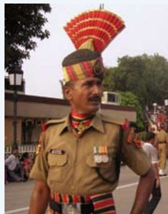
Indisch militair aan de grens.