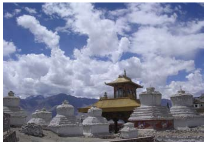
Chortens in Leh