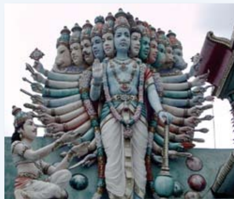
La Trinité : Brahma, Vishnou et Shiva