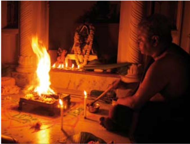
Entretien du feu.