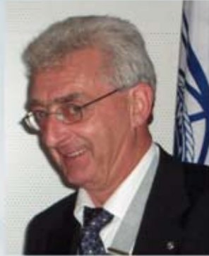
Jean-Claude Schmitz Governor 2008-09