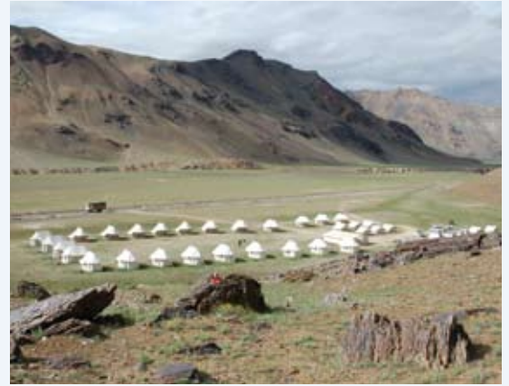
Het tentenkamp van Sarchu