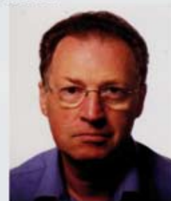
Claude Clais West Vlaanderen zuid