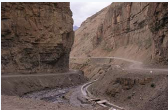
De weg door de bergen

In Karzok (4400m) logeren we weer in tentjes. Het dorpje loopt vol donkerhuidige nomaden in schilderachtige klederdracht. Vooral de vrouwen draaien heel de tijd met hun gebedsmolentjes. Ze zijn op bedevaart. Er is juist een religieus festival bezig. Onder de gaanderijen rond de binnenkoer van het plaatselijke klooster zit een orkestje met mooi uitgedoste muzikanten met cimbalen, trommels en fluiten. In het midden dansen enkele monniken rond de vlaggenmast. Ze slaan op platte trommels met een gekromde trommelstok. Hun passen zijn urenlang dezelfde. Het zijn feitelijk de pelgrims, die rondom zitten, die het mooiste beeld vormen. We blijken een dag te vroeg te zijn. Feitelijk is dit een soort