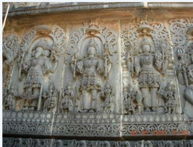
Temple de la Trinité