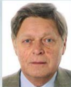
Jean Guillaume Deux Luxembourg