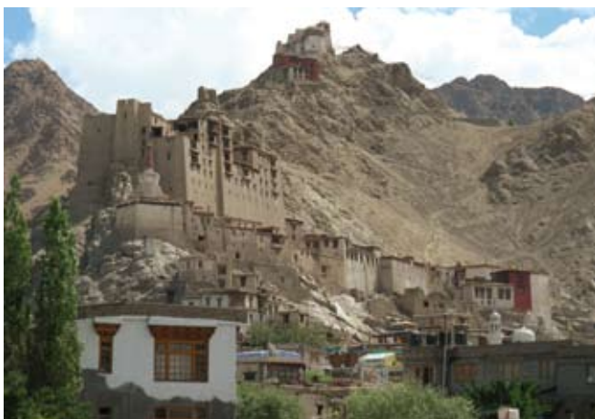
Paleis van Leh

Ik heb er altijd naar uitgekeken om, na aan de oevers van de Nijl, de Tigris en de Eufraat, ook eens aan die van de Indus te staan, zoals Alexander. Het is immers een historische rivier. Volgens de legende zal aan de laatste brug voor de stad Leh aan het einde der tijden de slag plaatsvinden tussen de koning van Shambhala en de troepen van het kwaad. Ook hier was ik te vroeg. Alhoewel we regelmatig moesten stoppen om op de smalle weg colonnes legertrucks te laten passeren, zag het er eigenlijk vrij vredig uit. Ik ben feitelijk altijd te vroeg. In de vlakte van Megiddo in Israël enkele jaren geleden, het Armageddon van de Bijbel, was toen ook nog niets aan de hand! Leh is een stadje met ongeveer 25.000 inwoners. Het stadsbeeld wordt beheerst door het oude paleis van de koningen van Ladakh op de heuvel. Die zijn hier wel al sinds 1930 weg, en het gebouw is echt onderkomen. Het wordt wel eens vergeleken met de Potala van Lhasa, maar het is veel kleiner en kleurloos. In de kleine straatjes vindt men het