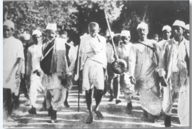
Gandhi lors de la Marche du sel

En guise de conclusion à cette approche de l'hindouisme je voudrais citer un homme qui a marqué la première moitié du 20e siècle, qui a influencé de nombreux mouvements de libérations et de droits civiques autour du monde et qui a inspiré de nombreuses personnalités comme Albert Schweitzer, Martin Luther King, Nelson Mandela, le dalaï lama et Aung San Suu Kyi. Cet homme, apôtre de la totale non-violence, c'est Gandhi.