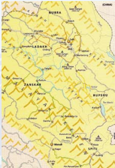
Kaart van Ladakh

jaar oud. De gebedsruimten zijn bedekt met kleurige, wel wat afgebleekte schilderijen, maar zijn aardedonker, zodat foto-opnames niet mogelijk zijn. Aan de overkant van de rivier ligt het klooster van Ky. Het bestaat uit een echte piramide van witte op elkaar gestapelde bouwsels. Er is juist een gebedsdienst bezig in de centrale tempel. De overheersende kleur is duidelijk. De monniken met hun rode gewaden zitten op rode lage banken met rode kussens tussen rode pilaren. Ze zitten mooi op twee rijen eentonige gebeden te reciteren. Sommigen slaan af en toe op grote groene platte trommels, anderen blazen op fluiten, de grootste wel twee meter lang. De dienst loopt juist ten einde, want na enkele minuten houdt iedereen