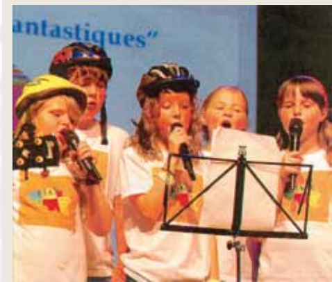
Si le 15 e Congrès était synonyme d'assemblée générale pour le Kiwanis, il fut aussi question de convivialité lors de quelques dégustations et du spectacle des "Enfantastiques".

Outre l'aspect protocolaire de l'assemblée générale du club, l'équipe arlonaise avait également mis les petits plats dans les grands pour recevoir dignement ses invités. Ce point culminant de l'année kiwanienne, le club arlonais l'avait voulu avant tout convivial, gastronomique et éducatif. Tout était donc au point pour accueillir les délégués et leurs familles, leur faire découvrir Arlon et sa région et proposer des animations de qualité dont la grande soirée de gala au Hall Polyvalent samedi soir. Ce moment fut une grande réussite avec plus de 300 participants kiwanis, mais pas uniquement. Cette soirée était en effet ouverte au grand public pour permettre de faire découvrir ce club et son idéal de partage, de générosité, d'entraide et d'amitié. JEAN-FRANÇOIS FONCK