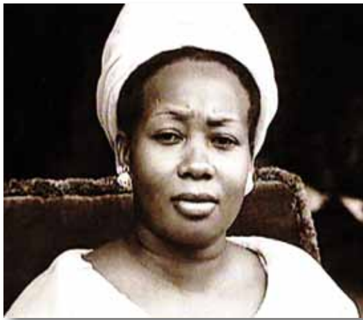
Mevrouw Antoinette Mobutu.