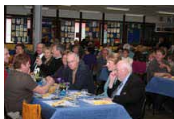
Une table d'honneur en appétit Prêtes pour le rush des affamés