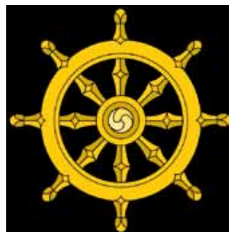
La roue du Dharma

Le Bouddha prétendit toujours n'être qu'un humain pur et simple, enseignant que tout homme pouvait, grâce à ses efforts et à son intelligence, aboutir à l'Eveil.