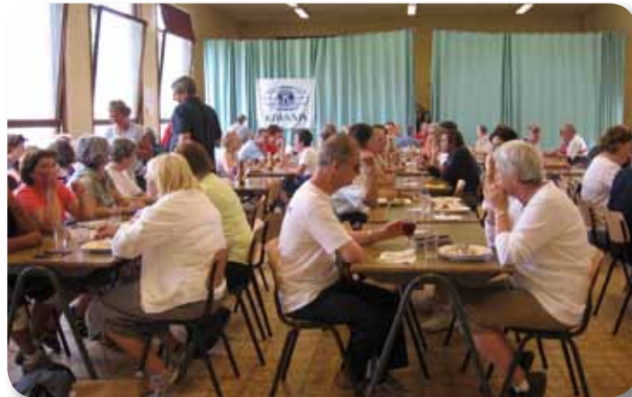
Une partie des marcheurs au repos et de kiwaniens sympathiques

Nous avons ainsi pu désaltérer et rassasier nos nombreux « clients » au point que la cuisine fut « épuisée » dès 16 heures ne laissant aux derniers visiteurs que la possibilité de se désaltérer . . .