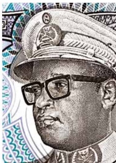
Mobutu op postzegel.

Lubumbashi enzovoort. De standbeelden van Leopold II, Stanley en Albert I werden van hun voetstuk gesleurd.