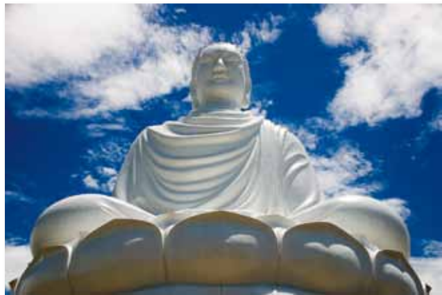
Statue du Bouddha au Vietnam

Littéralement Bouddha signifie «Eveillé », qui a obtenu sa réalisation sur terre.