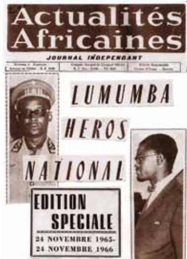
Lumumba in eer hersteld.

Ondertussen kreeg Mobutu door zijn dictatoriaal optreden ruzie met de Kerk en de studenten. Zo viel kardinaal Malula in ongenade, en waren er rellen in Lovanium in 1969 en 1971. Er vielen meer dan 100 doden. In 1971 lanceerde hij zijn campagne voor 'l'Authenticité'. Alles wat niet echt Kongolees was moest verdwijnen. Hij voerde de 'drie Z' in. Zowel de stroom, het land als de munt moesten nu 'Zaire' heten. Dit was een wat komische vergissing, want het is helemaal geen Kongolees, maar een Portugese verbastering van het woord Nzadi, dat rivier betekent. De mooie blauwe vlag met de gele ster verving hij door een lelijke groene. De christelijke voornamen moesten verdwijnen, en werden vervangen door Bantu namen. Hierin kan ik hem feitelijk een beetje volgen. De missionarissen hadden de zwarte kindjes immers bijna steeds de naam opgesolferd van de 'heilige van de dag'. Zo heetten ze Cléophas, Anicet, Theotime of Symphorien! Mobutu zelf veranderde zijn Joseph Désiré in Sese Seko. Het kostuum met das was verboden en iedereen moest zich uitdossen in een 'abacost' (à bas le costume!), een soort Mao pakje. De dames moesten jeans en minirokjes weggooien, en hun mooie vormen verhullen in lange 'pagnes'. De steden waren al vroeger van naam veranderd. Leopoldstad werd Kinhasa, Stanleystad Kisangani, Elisabethstad