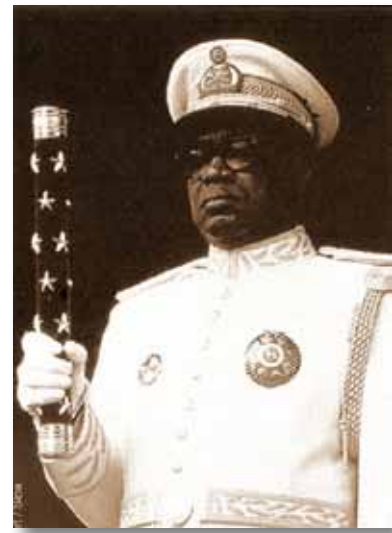
De maarschalk in gala uniform.

die met zijn Ruandees Bevrijdingsleger op zijn beurt de Hutu's achternagegaan. Die zaten met miljoenen in vluchtelingenkampen op Kongolees grondgebied, en werden nu zelf slachtoffer van een tweede genocide. Ze werden naar het Westen gejaagd en met honderdduizenden neergemaaid.