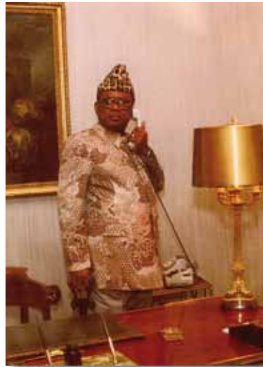
De chef wordt steeds dikker.