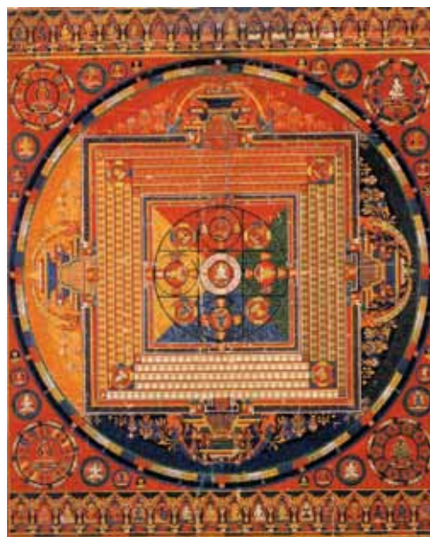
Mandala de Vairadhatu

On a pu qualifier le Bouddhisme de «conception purement philosophique» ou d'une religion sans Dieu. En fait et au cours des siècles, se sont développés des courants de pensée différents, mais qui reconnaissent cependant tous l'enseignement initial du BOUDDHA et en particulier les quatre Nobles Vérités et le sentier octuple.