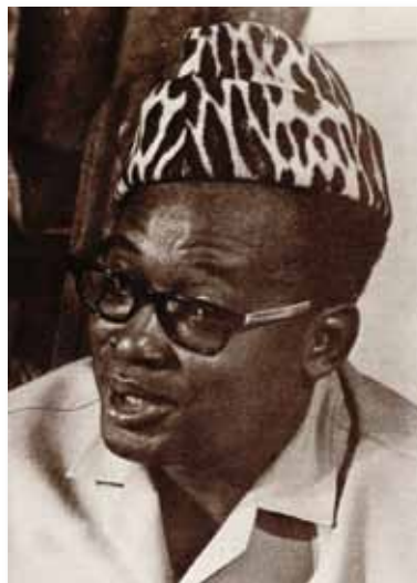
De chef met de luipaardmuts.