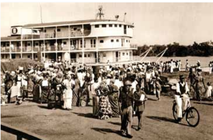
Het presidentiële jacht.

laaiden dan de gevechten tussen Hutu's en Tutsi's terug op. Die draaiden uit op een militaire verovering van het land door de 'Alliance des Forces Démocratiques pour la Libération, een samenraapsel van rebellengroepen onder leiding van Kabila. Feitelijk was hij maar de stroman voor de Ruandese Tutsi's onder Kagame. Na de genocide van 1994, waar Hutu's bijna een miljoen Tutsi's en gematigde Hutu's met machetes hadden afgemaakt, was