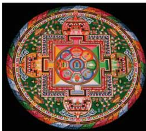
Mandala de Kalachakra - roue du temps

« C'est cette « soif » qui produit la re-existence et le re-devenir qui est liée à une avidité passionnée et qui trouve sans cesse une nouvelle jouissance tantôt ici, tantôt là, à savoir la soif des plaisirs des sens, la soif de l'existence et du devenir et la soif de la non-existence »