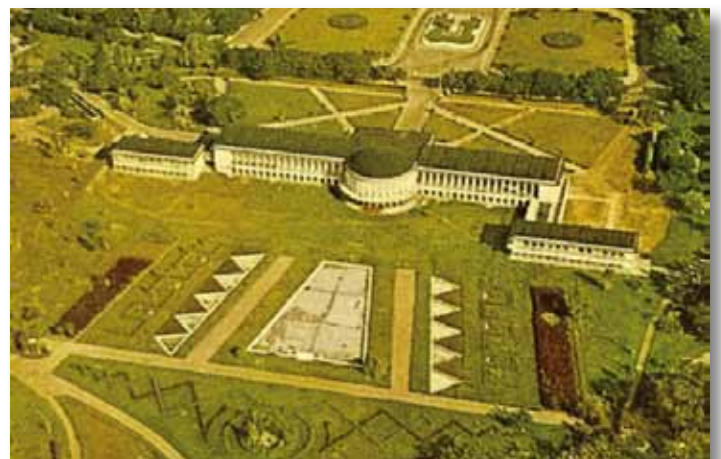
Het presidentieel paleis.