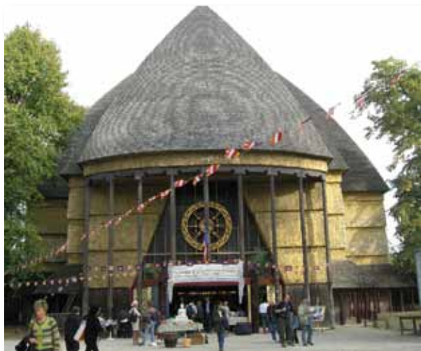
La Pagode de Vincennes se trouve dans le Bois de Vincennes, dans le 12e arrondissement de Paris, dans un des vestiges de l'exposition coloniale de 1931.

L'essentiel de l'enseignement du Bouddha est contenu dans les quatre Nobles Vérités.