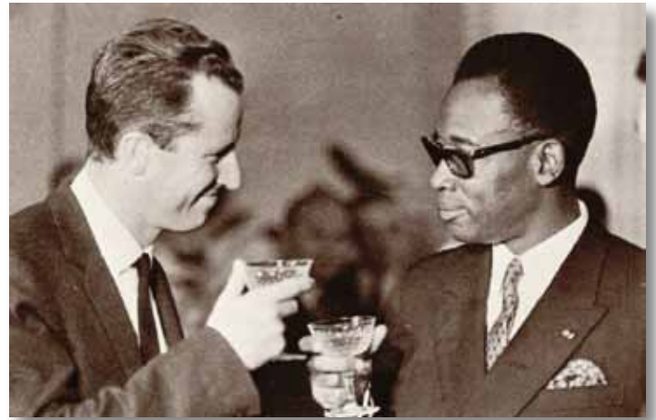
Met zijn goede vriend koning Boudewijn