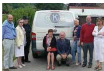
Des Membres ravis de célébrer l'événement