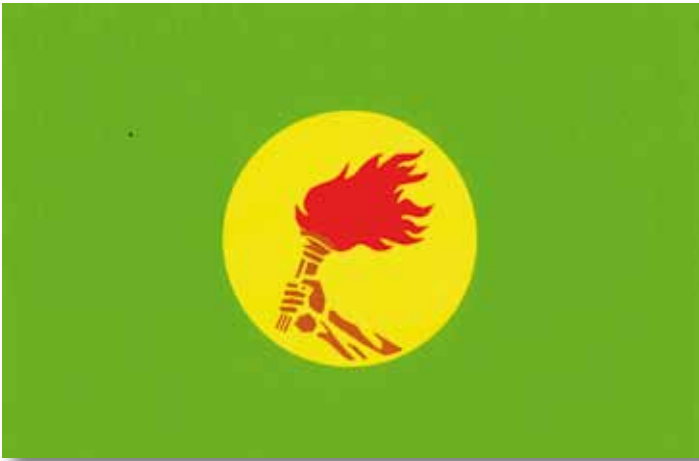
Nieuwe vlag met MPR fakkel