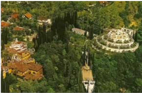
Park van het Vittoriale degli Italiani in Gardone.