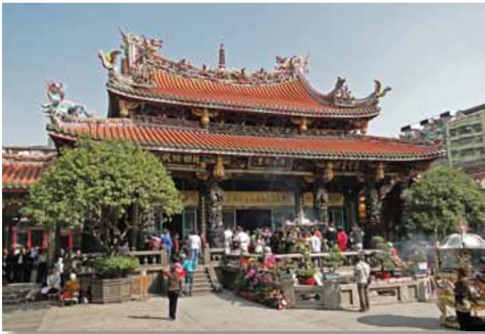
Stèle funéraire dans un temple taoïste de Canton Le temple de Longshan à Taipei, Taiwan.