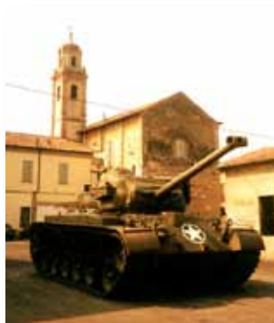
Tank achter de kerk van het Brescello van Don Camillo.