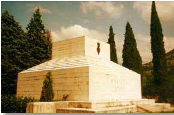
Monument van de slag van Rivoli in 1797 aan het Gardameer.