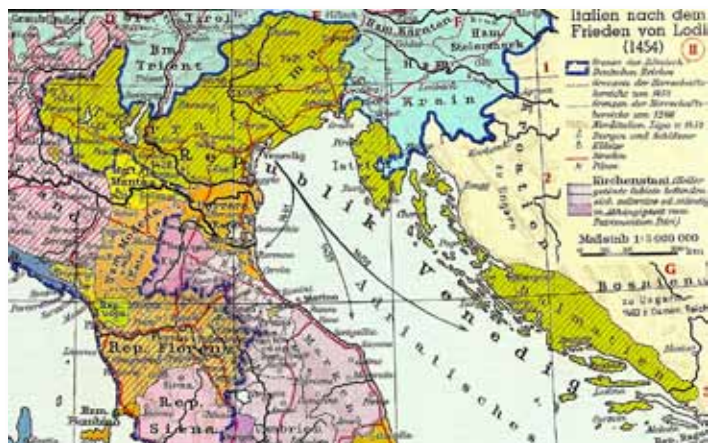
Het 'Terraferma' van Venetië in de helft van de vijftiende eeuw.