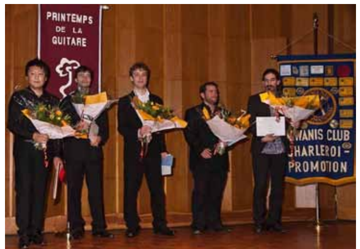
groupe des finalistes