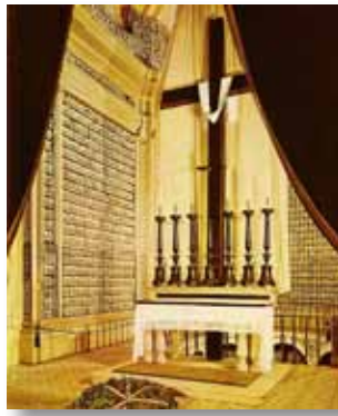
Herdenkingskapel met ossuarium in Solferino.