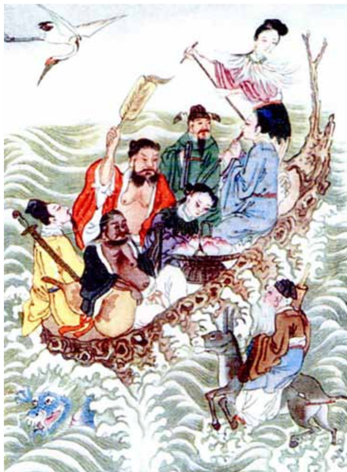
Les huit Immortels traversant la mer. Comme les chamans, ils sont maîtres des éléments

« Pluie nouvelle dans la montagne déserte, Air du soir empli de la fraîcheur d'automne, Branche de pin s'ouvrant aux rayons de lune, Une source pure caresse les rochers blancs. Dans les lotus passent les barques des pêcheurs, Rires entre les bambous, c'est le retour des lavandières. Ici et là rode encore le parfum du printemps, Que ne t'attardes-tu aussi, noble ami. »