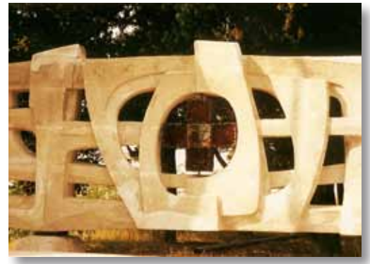
Rode Kruismonument in San Martino della Battaglia.

had feitelijk een heel deel van de Dalmatische kust (nu Kroatië) bij zijn land willen inlijven, maar dat was te hoog gegrepen. In een grote zaal van zijn villa hangt nu de tweedekker aan het plafond waarmee hij na de oorlog over Wenen was gevlogen om de vijand te treiteren door pamfletten uit te gooien met het bericht van de Victorie. Met een kleine torpedoboot heeft hij ook eens een raid uitgevoerd naar de baai van Buccari bij Fiume waar hij flessen achterliet met Italiaanse vlaggen in! Dit bootje kunt U ook nog zien in een bijgebouw in zijn park. Daar is zelfs de voorsteven van een oorlogsschip, de 'Puglia', waarop hij heeft gevaren, in een helling ingebouwd. Na zijn dood werd er voor hem daarnaast een pompeus grafmonument opgericht. Daar staat nu zijn granieten doodskest op een hoge zuil te pronken. De villa zelf is volgepropt met zowat 2000 kunst- en andere voorwerpen en 30.000 boeken. Boven zijn bed ligt een kopie van het 'Aurora' of 'Dageraad' beeld van Michelangelo, een voluptueuze, goed in het vlees zittende vrouwenfiguur die precies wat moeilijk wakker wordt. Hier deel ik wel de smaak van de man, want dit is ook altijd mijn favoriete beeld geweest. Het origineel vindt U in de Medicikapel in Firenze. In d'Annunzio's slaapkamer is ze geflankeerd door de 'Slaven'