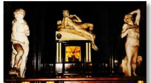
Beelden van Michelangelo in d'Annunzio's slaapkamer.