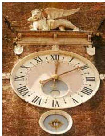
De gevleugelde leeuw van San Marco, patroon van Venetië.