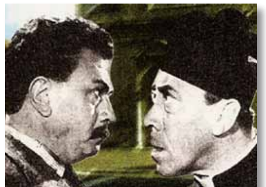
Peppone en Don Camillo uit de filmen.