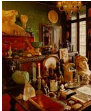
Volgepropt bureau van Gabriële d'Annunzio.