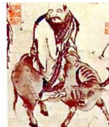
Image classique de Lao Tseu s'en allant vers l'Ouest monté sur un buffle.

Le fondateur du Taoïsme serait le Souverain jaune HOUANG TSEU qui a vécu de 2597 à 2497 avant J.C. Mais ce sont surtout les écrits de LAO TSEU et de TCHOUANG TSEU, vers le VI e siècle avant J.C, qui donnèrent une véritable impulsion au Taoïsme.