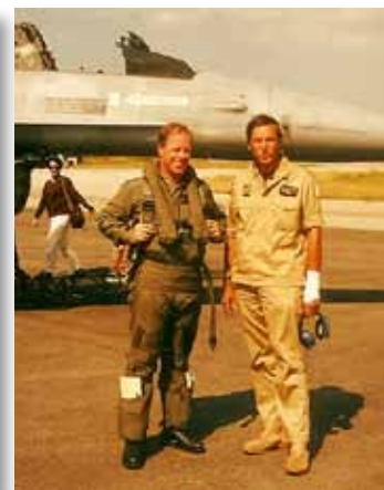
Op het vliegveld van Villafranca. Let op de 'oorlogsverwonding'.