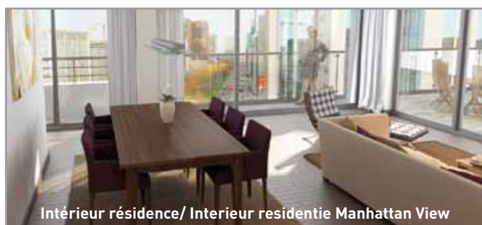
Intérieur résidence/ Interieur residentie Manhattan View

Ontdek bij Brussels Projects alle oplossingen onder één dak!