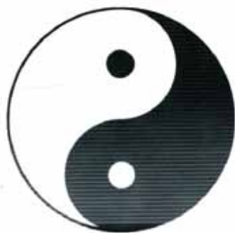
Taijitu montrant les relations entre le Yin et le Yang

« Le TAO engendre Un, Un engendre Deux, (YIN et YANG), Deux engendre Trois, Trois engendre tous les êtres du monde, tout être porte sur son dos l'obscurité et serre dans ses bras la lumière. Le souffle indifférencié constitue son harmonie ».