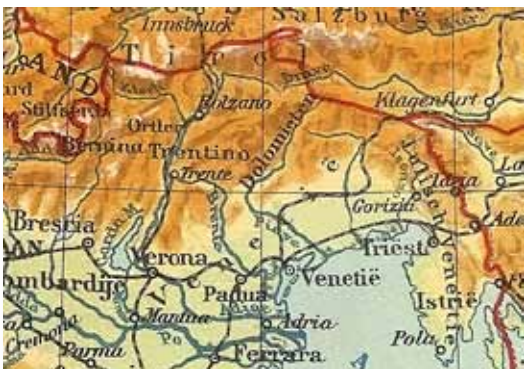
Kaart van Noord-Oost Italië na WO I.