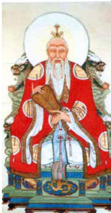
Lao Tseu en dieu taoïste avec l'éventail en main