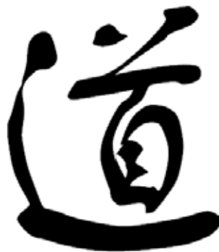
Dào « la Voie », calligraphie « herbes folles », un style très libre influencé par le taoïsme.

La fin de l'Antiquité – aux alentours de 500 av. J.-C. – voit la Chine évoluer vers la formation d'États militaires. Des réformes affectent l'administration, la juridiction et, partant, l'ensemble de la société, alors que se développent le commerce et l'artisanat. Dans cette Chine en pleine évolution se fait jour une fermentation intellectuelle. Elle va notamment transformer le sentiment religieux.