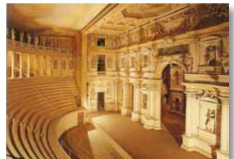
De scène van het Teatro Olimpico

in 1628 het Corral de las Comedias, dat er nog steeds staat. Deze laatste theaters waren wel nog niet overdekt.