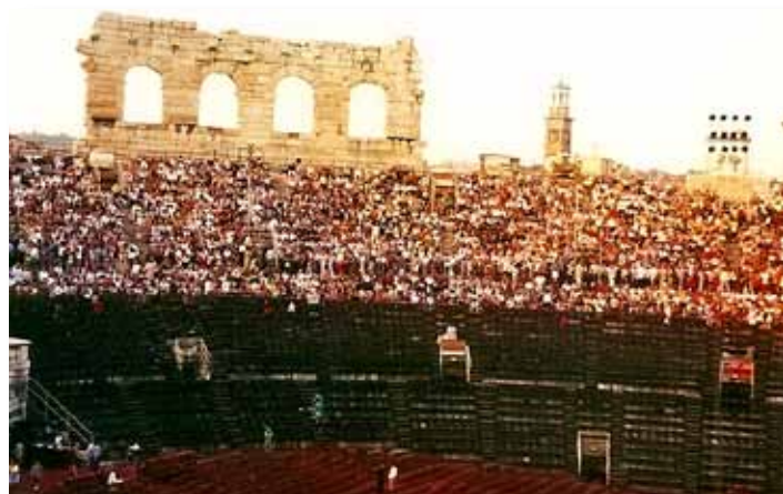
De minder kapitaalkrachtige toeschouwers op de bovenste rijen.