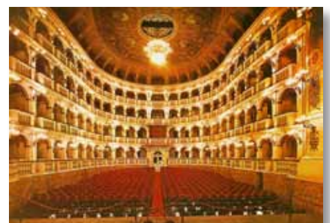
Het Teatro Comunale van Bologna.