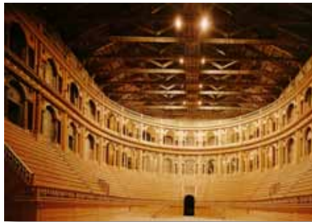
Het imposante Teatro Farnese in Parma.