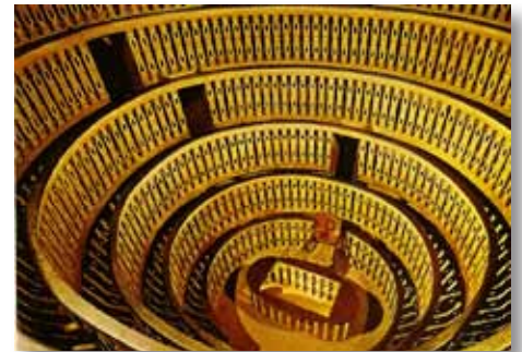
Het anatomietheater van de universiteit van Parma.

In Mantua heb ik bij toeval nog een theater kunnen bezoeken. Ik liep daar op een regenachtige zondagvoormiddag eens een beetje verloren door de straatjes van de oude stad toen ik plots werd aangesproken door een brave Italiaan die geheel uit sympathie mij de stad wilde laten zien. Hij kende goed de weg, want kreeg het klaar om de portier van het, toen voor het publiek gesloten, Teatro Scientifico te doen openen. Het werd zo genoemd omdat het ingericht is, in 1769, in de gebouwen van de Accademia di Scienze e Lettere. In die tijd kregen de theaters geen treden meer, maar balkons. Dit theater had ze op vier verdiepingen en was wel nog voorzien van een vast decor op de scène, bestaande uit twee verdiepingen vensters afgewisseld met beelden in nissen. Het toeval wil dat ik dit op televisie onlangs erkende. Hier is een filmopname gemaakt van de opera (sorry, maar weer van Verdi) Rigoletto. Het diende als decor voor het orkest geleid door dirigent