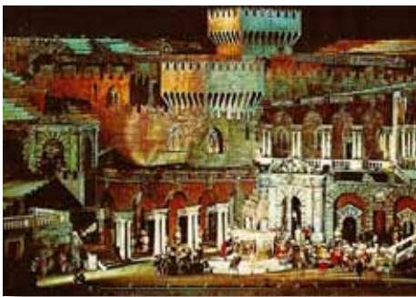
Decor van de opera Rigoletto in de arena van Verona.