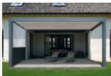
B-300 ODL (Vouwdak)