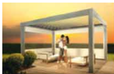
B-200 ODL (Louvres)