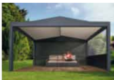
B-400 ODL (Topscreen)