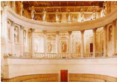
Het theatertje van Scamozzi in Sabionetta.

Zubin Mehta. De echte actie werd geschoten in de zalen van het hertogelijk paleis en het Palazzo Te met hun muurschilderingen van Andrea Mantegna en Giulio Romano. Mantegna blijkt tot in onze tijd nog bewonderaars te hebben. Op zijn graf in de San Andreakerk zag ik immers een ontroerende verse donkerrode roos liggen! Mijn gids toonde me ook het zogenaamde huisje van Rigoletto, de hofnar van de hertog in de opera. Die hertog verleidt de dochter van de nar, en het verliefde kind komt droevig aan haar einde. De echte hertogen waren de Gonzaga's. Het is aan hun hof dat onze Antwerpse Rubens een tijdje als hofschilder gewerkt heeft. In het paleis is een enorm schilderij te bewonderen van zijn hand dat de hertogen Guglielmo en Vincenzo met hun eega's in aanbidding voor de Heilige Drievuldigheid voorstelt. Het is ook in hun paleis dat de eerste 'echte' opera werd gespeeld op 24 februari