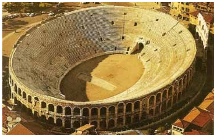
De Romeinse arena van Verona uit AD 30.

Het duurde zowat 1500 jaar voor er weer speciale gebouwen werden opgericht voor theatervoorstellingen. De Romeinen waren inderdaad hun tijd voor. Denk maar aan hun sanitair en hun centrale verwarming. In de Middeleeuwen speelde men toneel op kleine podia op schragen op de markten, en voor de rijken gebeurde dat in de zalen van hun kastelen. Het eerste overdekte theatergebouw dat speciaal voor dat doel is gebouwd staat in