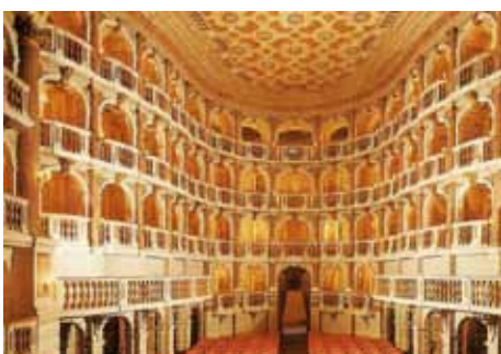
Het Teatro Scientifico van Mantua