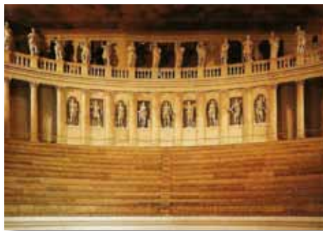
Het Teatro Olimpico van Palladio in Vicenza