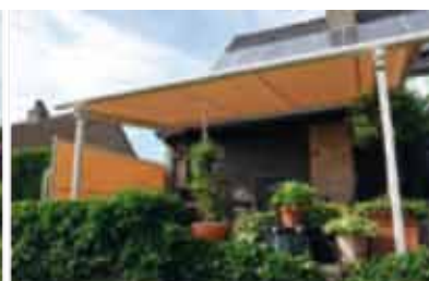
B-100 ODL (B-127 Pergola)