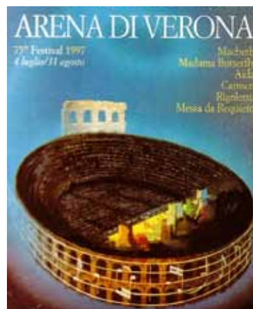
De opera programmatie van de zomer 1997.