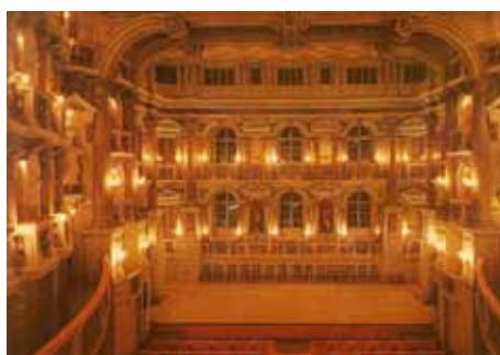
De scène van het Teatro Scientifico.