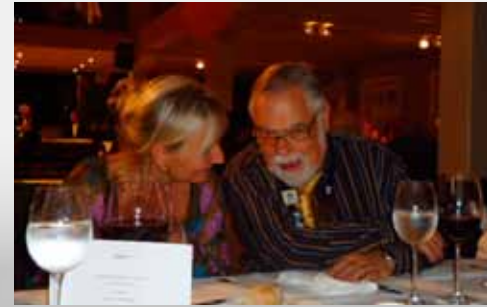
Vriendschapsdiner Dîner de l'Amitié

De dynamische divisie West-Vlaanderen heeft geen moeite gespaard om een zeer geslaagd congres te organiseren. De foto's illustreren de belangrijkste momenten van het congres : de opening op het stadhuis van Kortrijk in aanwezigheid van burgemeester Stefaan De Clerck, de prachtige vriendschapsavond en het congres zelf in Kinopolis waarop 96 clubs waren vertegenwoordigd met meer dan 520 ingeschreven kiwaniers, een record.