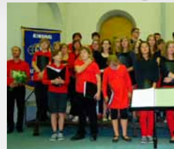
Vox Musica Openingsessie Ouverture