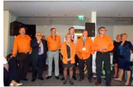
Schitterend organiserend team Le team orange, grand organisateur du Congrès

La dynamique division de West-Vlaanderen a mis toute son énergie pour nous concocter un congrès très réussi. Voici en quelques photos, les étapes importantes de ce congrès : l'ouverture à l'hôtel de ville de Courtrai en présence du bourgmestre Stefaan De Clerck, la belle soirée de l'amitié et le congrès à Kinépolis où 96 clubs étaient représentés et plus de 520 kiwaniens inscrits.