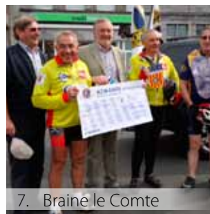
7. Braine le Comte