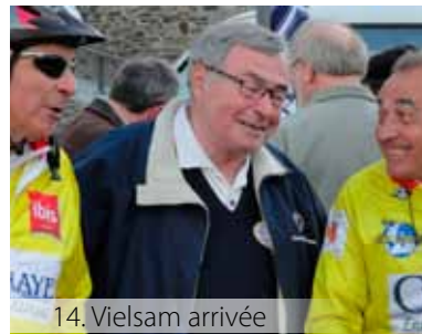
14. Vielsam arrivée