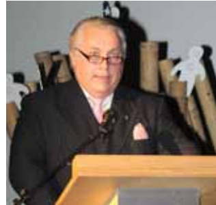
Alain Bourguet Gouverneur elect