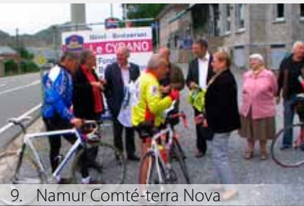
9. Namur Comté-terra Nova