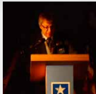
LGT Yves Dorny Host Division