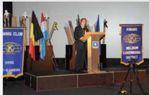
Het rapport van de gouverneur Le rapport de Gouverneur