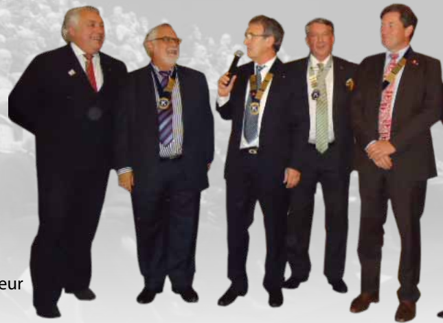
Amtsoverdracht -Passation de fonctions dans la bonne humeur