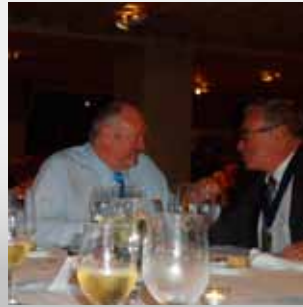
Vriendschapsdiner Dîner de l'Amitié