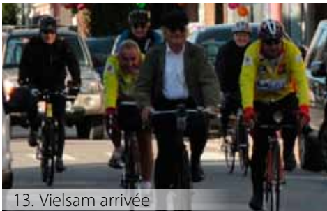
13. Vielsam arrivée