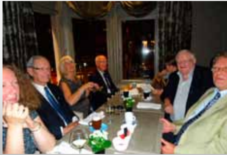
Diner past-gouverneurs Les past dînent