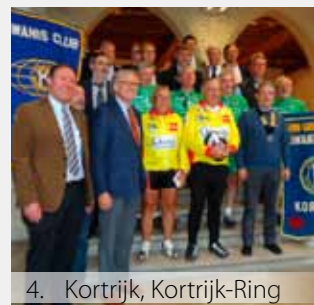
4. Kortrijk, Kortrijk-Ring