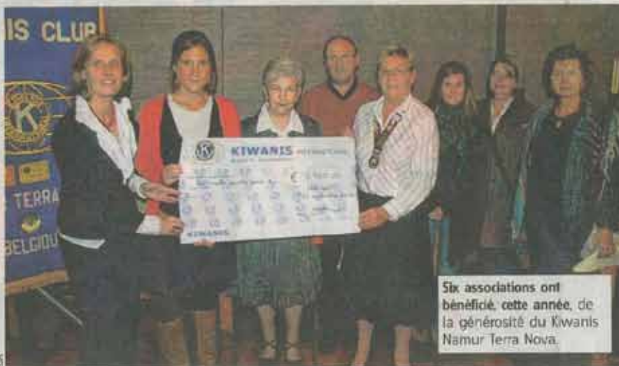
Six associations ont bénéficié, cette année, de la générosité du Kiwanis Namur Terra Nova.

L'ASBL Saint-Vincent de Paul de Salzennes, qui vient en aide à des dizaines de familles défavorisées, pourra, quant à elle, offrir des cadeaux aux enfants pour la Saint-Nicolas. ■