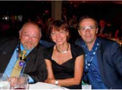
Organisatie Vriendschapsdiner L'organisateur diner de l'Amitié