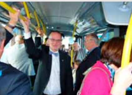
Op weg naar ... plezier op de LIJN En route vers le souper des past. Les joies de De Lijn