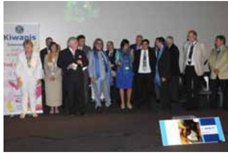
Gouverneur elect en fanclub GVélect et ses fans