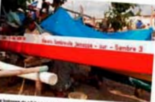
Des bateaux de pêche pour permettre aux Philippines de sortir leurs familles.