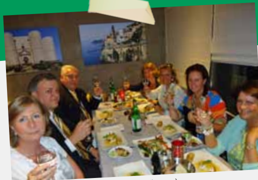
KC HOEYLAERT-ZONIENWOUD (in op.)