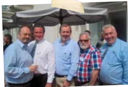
KIEF Conference Annecy