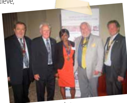
UK Convention - Croydon