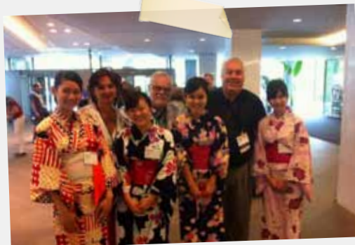
KI Convention - Tokyo