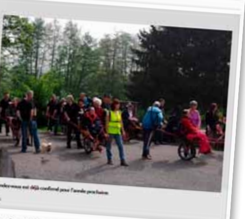
Le rendez-vous est déjà confirmé pour l'année prochaine.

Les membres du Kiwanis de Sambreville se sont à nouveau mobilisés pour venir en aide aux membres du CIDMAT, le Centre d'identification et de documentation des matériels.