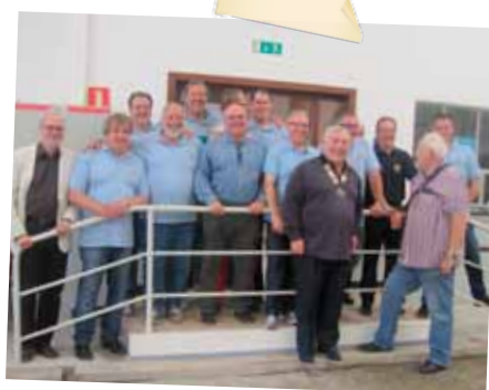
KC Esch S/Alzette