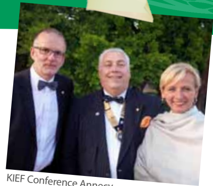
KIEF Conference Annecy