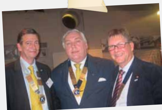
Present & Future