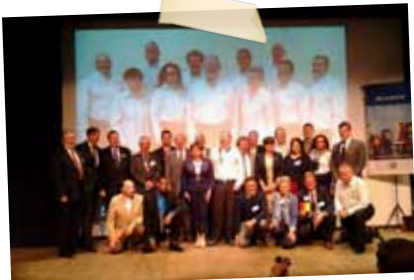
KIEF Conference Annecy