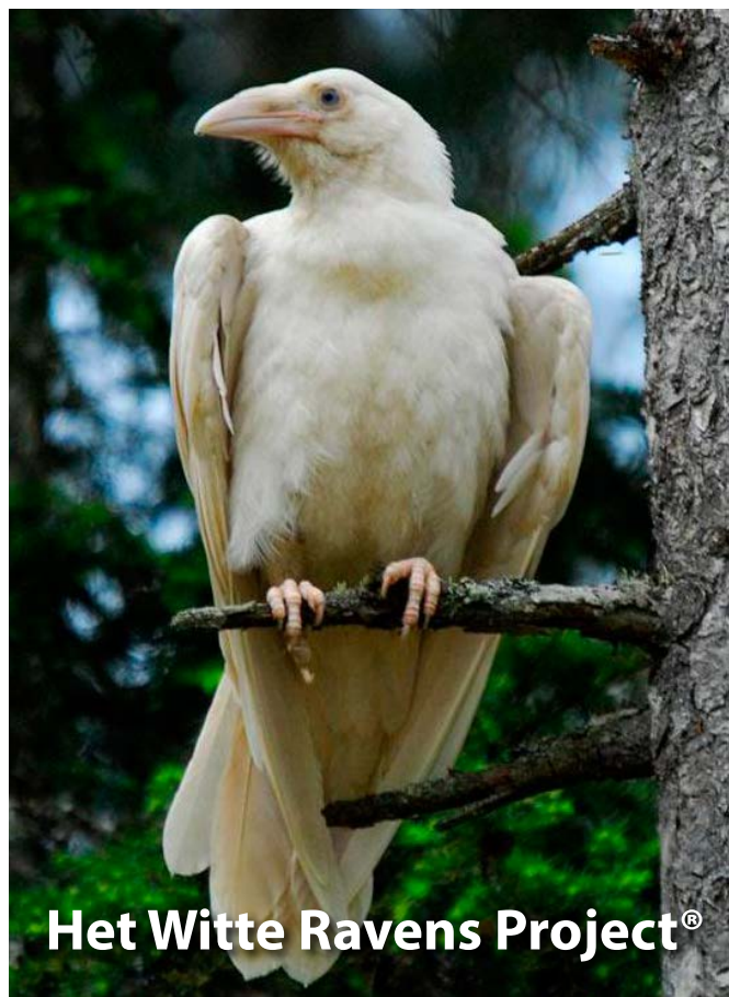
Het Witte Ravens Project®

Since the White Ravens project began, at least 800 children have been directly helped with new clothing, food, educational materials, footwear and more. According to figures released by the Kiwanis club, more than 12 percent of Flemish children live in a household with an income below the regional Flemish poverty-risk threshold. If Kiwanis didn't exist, who would help these children? Who would step up to put clothing on their backs, shoes on their feet? What would happen to those children and what would their futures look like?