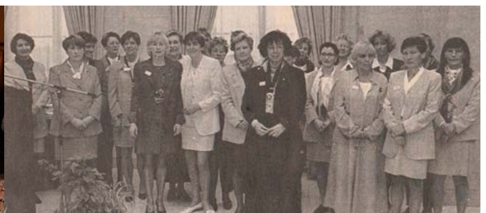
20 ans séparent ces deux photos