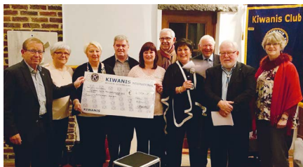
Réunion statutaire du 15/2/2017 : remise des chèques

Grâce à cette soirée, et aux excellents résultats de nos autres actions et ventes, nous avons pu distribuer la considérable somme de 4.355€ à toutes les actions sociales que nous aidons et envoyer 8 enfants à la mer cette année !