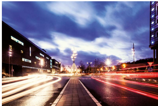
Carbon Hotel C-Mine Cultuurcentrum